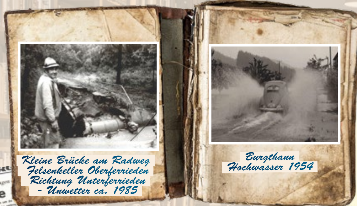
Kleine Brücke am Radweg Felsenkeller Oberferrieden Richtung Unterferrieden - Unwetter ca. 1985