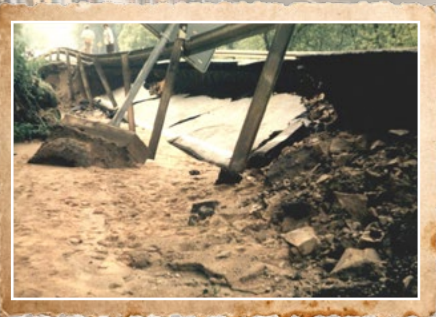
1980 Unwetterschäden an der B8